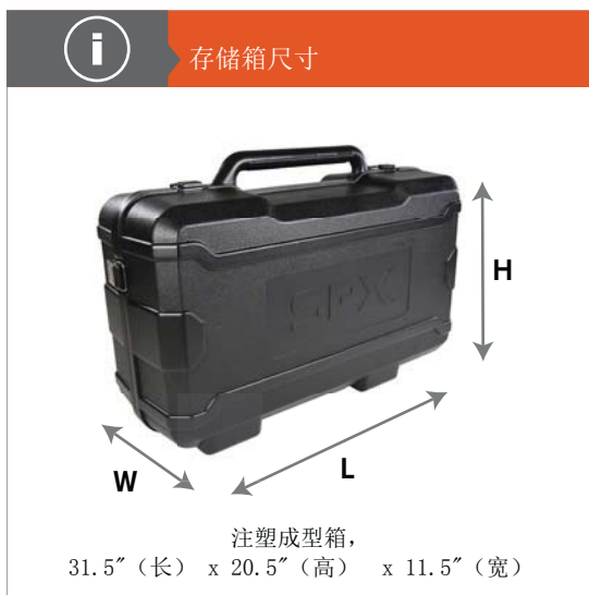
注塑成型箱, 31.5" (长) x 20.5" (高) x 11.5" (宽)

以短吨显示值 (2,000 磅)。要转换为长吨, 乘以 0.893。要转换为公吨, 乘以 0.907。