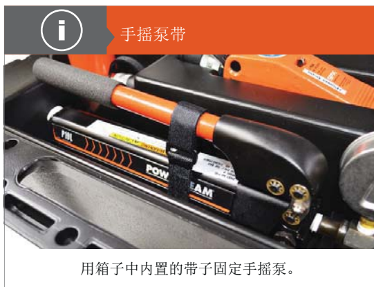
用箱子中内置的带子固定手摇泵。